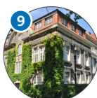
Edmund-Siemers-Allee 1 ESA Flügelbau Ost