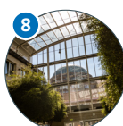
Edmund-Siemers-Allee 1 ESA Flügelbau West