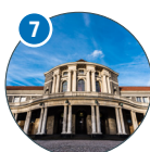
Edmund-Siemers-Allee 1 ESA Hauptgebäude