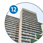
Bundesstraße 55 Geomatikum