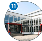
Martin-Luther-King-Platz 6 Chemie