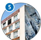
Von-Melle-Park 9 Sozialökonomie