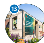
Von-Melle-Park Tiny House