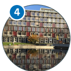
Von-Melle-Park 8 Erziehungswissenschaft