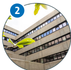
Von-Melle-Park 5 WiWi