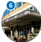
Schlüterstraße 28 Rechtshaus