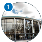
Von-Melle-Park 4 Audimax