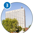
Von-Melle-Park 6 Phil-Turm