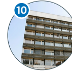
Martin-Luther-King-Platz 3 Zoologie